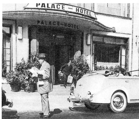
Der amerikanische Zeitungskönig R. W. Hearst in Davos

Zürich - München (Oktoberfest), 3. und 4. Oktober. Fahrpreis ab Zürich Fr. 21.45, St. Gallen Fr. 16.05, Rorschach Fr. 15.15, Romanshorn Fr. 16.05, Frauenfeld Fr. 18.65, Weinfelden Fr. 17.55.