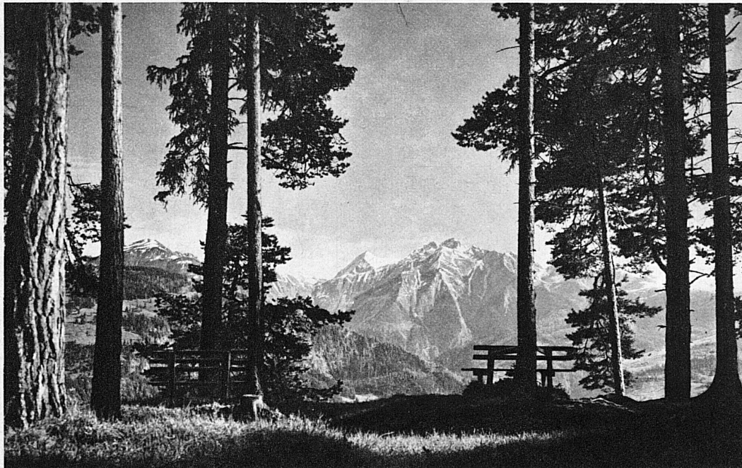
Bei Flims - Près de Flims

Schwimmbädern gefasst. Den ganzen Sommer über entfaltet sich im ganzen Lande ein herrliches Badeleben, vom Strand der Seestädte bis hinauf an die Siedlungsgrenzen der Hochterrassen und Passhöhen. Das «dolce far niente» birgt den Keim der Langeweile. Nichts aber vermag das Ferienglück so gründlich zu zerstören wie sie. Darum gehört zum Strand- und Badeleben sein Kontrast, das Bergsteigen. Und nun, in dieser abwechslungsreichen Verbindung, steigert ein Genuss den andern.