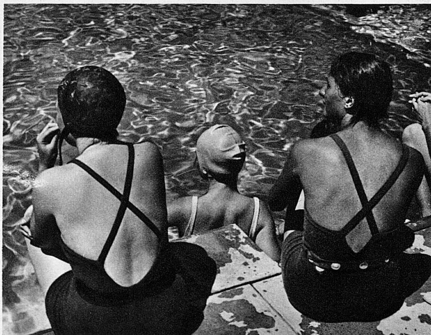
Im Schwimmbad - Heures rafraîchissantes à la piscine de Vulpera - The Swimming Pool at Vulpera