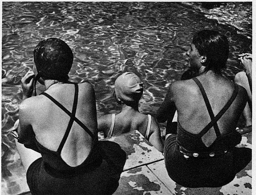
Im Schwimmbad - Heures rafraîchissantes à la piscine de Vulpera - The Swimming Pool at Vulpera