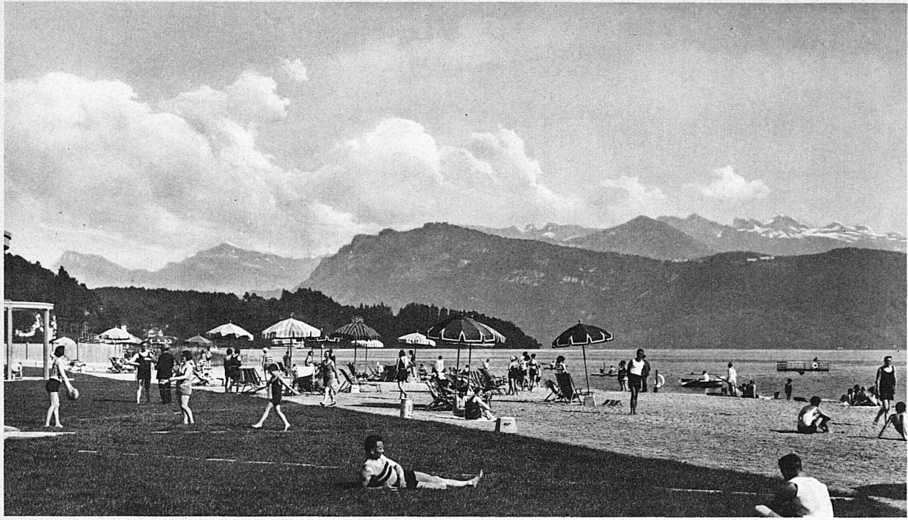
Strandbad Lido Luzern - Le Lido de Lucerne - Bathing Beach Lido, Lucerne