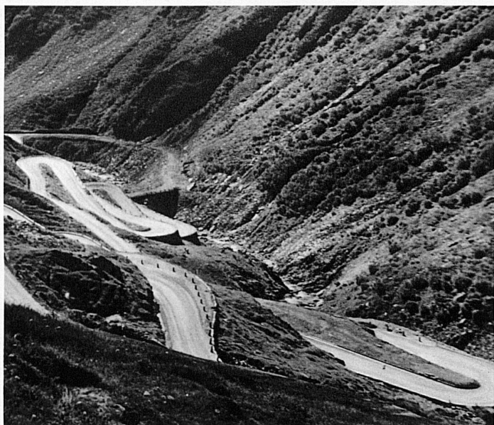
Les lacets du Val Tremola – In der Tremola

La route est une ligne mélodique, une danse qu'il suffit au voyageur d'orchestrer. Libre sous le ciel, elle inscrit sur la terre le paraphe d'une chorégraphie idéale. A elle seule elle caractérise un paysage par ses envols, ses rampes et ses pentes. Qui confondrait une route de Suisse avec celles qui traversent les plaines de la Beauce française ?