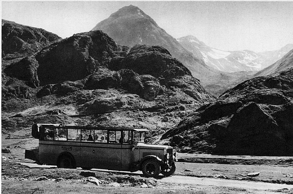
Car postal sur le Grand St-Bernard – Schweizer Alpenpost auf dem Grossen St. Bernhard

1250 Hôtels dans 350 stations et villes suisses vous offrent cette année les «séjours libres à forfait» tout compris à partir de fr. 6 pour la demi-journée fr. 8 pour la journée entière fr. 20 pour 3 jours fr. 46 pour la semaine.