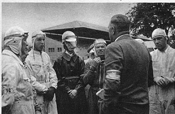
Dernières instructions - Ansprache vor dem Start