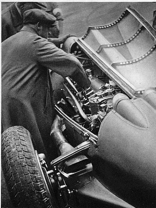
Ultime inspection - Letzte Prüfung

C'est en 1886 que Carl Benz obtint son premier brevet automobile et de ce brevet sont sortis les véhicules que nous verrons en août, sous le hurlement de leur compresseur et le rugissement de leur moteur, filer à une vitesse que Benz lui-même en 1886 n'aurait jamais osé rêver. La première automobile allemande était une voiture à trois roues, à un cylindre horizontal, donnant une puissance d'un cheval à peine, et la population entourait ce véhicule sans comprendre goutte à cette calèche sans chevaux, pionnier et précurseur d'une ère nouvelle. Il y avait encore, à cette époque, des gens qui, épouvantés par cette machine du diable, s'enfuyaient devant elle en la voyant arriver à la vitesse affolante de 10 km à l'heure. Aujourd'hui, il n'y a guère de voiture d'usage bien faite qui ne fasse ses 100 km à l'heure gaillardement; et les voitures de course qui disputeront le Grand Prix Automobile de Suisse en feront 3 et 4 fois davantage. Après 50 ans de développement! Il y a là matière à réflexion sur le rendement phénoménal de l'esprit humain et de la technique.