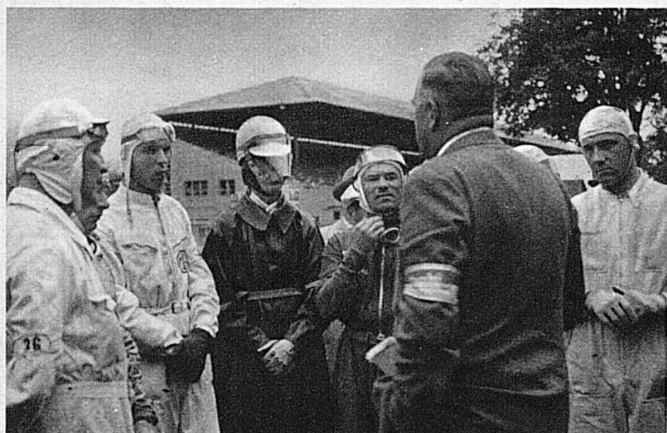
Dernières instructions - Ansprache vor dem Start

C'est en 1886 que Carl Benz obtint son premier brevet automobile et de ce brevet sont sortis les véhicules que nous verrons en août, sous le hurlement de leur compresseur et le rugissement de leur moteur, filer à une vitesse que Benz lui-même en 1886 n'aurait jamais osé rêver. La première automobile allemande était une voiture à trois roues, à un cylindre horizontal, donnant une puissance d'un cheval à peine, et la population entourait ce véhicule sans comprendre goutte à cette calèche sans chevaux, pionnier et précurseur d'une ère nouvelle. Il y avait encore, à cette époque, des gens qui, épouvantés par cette machine du diable, s'enfuyaient devant elle en la voyant arriver à la vitesse affolante de 10 km à l'heure. Aujourd'hui, il n'y a guère de voiture d'usage bien faite qui ne fasse ses 100 km à l'heure gaillardement; et les voitures de course qui disputeront le Grand Prix Automobile de Suisse en feront 3 et 4 fois davantage. Après 50 ans de développement! Il y a là matière à réflexion sur le rendement phénoménal de l'esprit humain et de la technique.