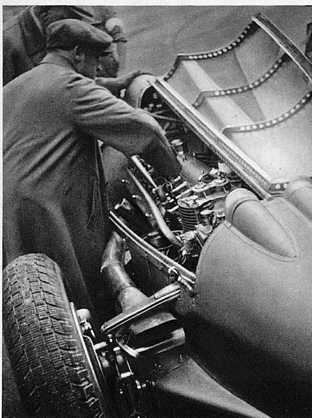
Ultimate inspection - Letzte Prüfung

C'est en 1886 que Carl Benz obtint son premier brevet automobile et de ce brevet sont sortis les véhicules que nous verrons en août, sous le hurlement de leur compresseur et le rugissement de leur moteur, filer à une vitesse que Benz lui-même en 1886 n'aurait jamais osé rêver. La première automobile allemande était une voiture à trois roues, à un cylindre horizontal, donnant une puissance d'un cheval à peine, et la population entourait ce véhicule sans comprendre goutte à cette calèche sans chevaux, pionnier et précurseur d'une ère nouvelle. Il y avait encore, à cette époque, des gens qui, épouvantés par cette machine du diable, s'enfuyaient devant elle en la voyant arriver à la vitesse affolante de 10 km à l'heure. Aujourd'hui, il n'y a guère de voiture d'usage bien faite qui ne fasse ses 100 km à l'heure gaillardement; et les voitures de course qui disputeront le Grand Prix Automobile de Suisse en feront 3 et 4 fois davantage. Après 50 ans de développement! Il y a là matière à réflexion sur le rendement phénoménal de l'esprit humain et de la technique.