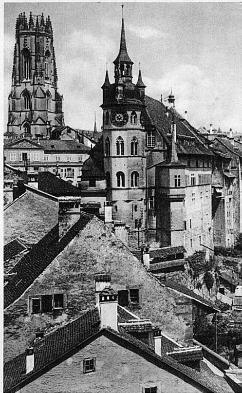
Freiburg: Tour de Bourguillon, Münster, Rathaus und Altstadt