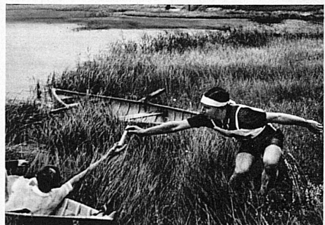
2. Heidseestafette in Lenzerheide 9. August

Die Eidg. Postverwaltung gewährt bei Vorweisung der Generalabonnemente eine Ermässigung von 10 % auf der gewöhnlichen Fahrtaxe für sämtliche Automobil- und Pferdekurse.