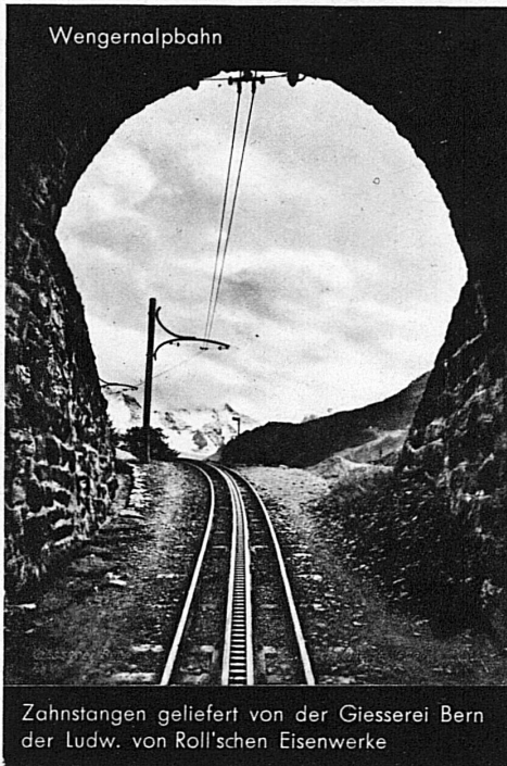
Zahnstangen geliefert von der Giesserei Bern der Ludw. von Roll'schen Eisenwerke

Walzwerke • Schmiede • Giessereien • Elektrostahlwerk • Mech. Werkstätten