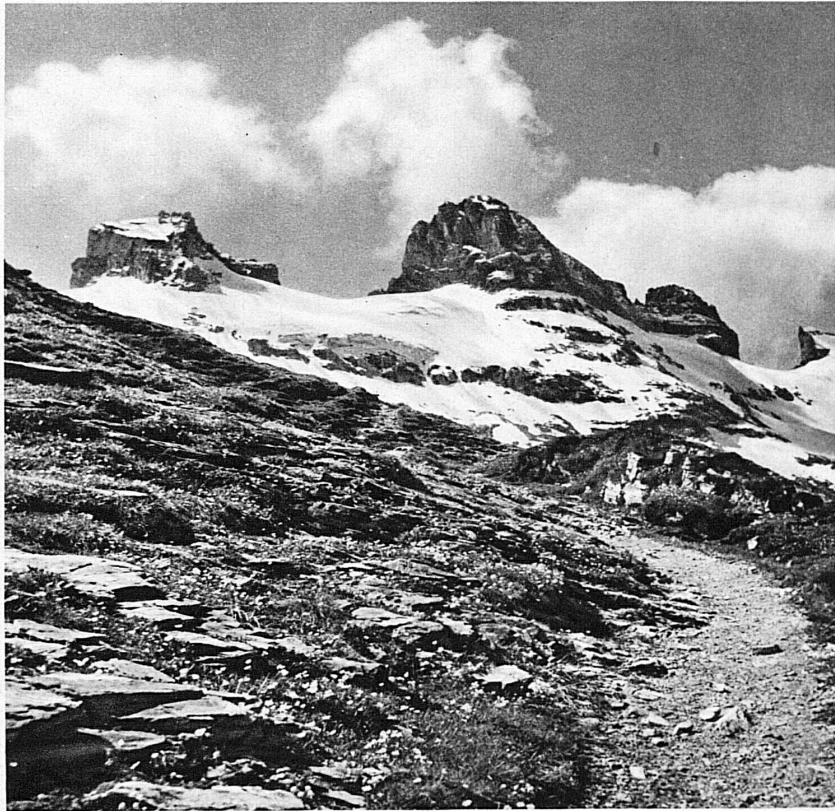
Le Jochpass - Am Jochpass bei Engelberg