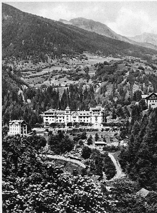
Bains de Passugg près Coire - Bad Passugg bei Chur

le dîner, la chambre, le petit déjeuner (ou le lunch au lieu du dîner), le pourboire, la taxe