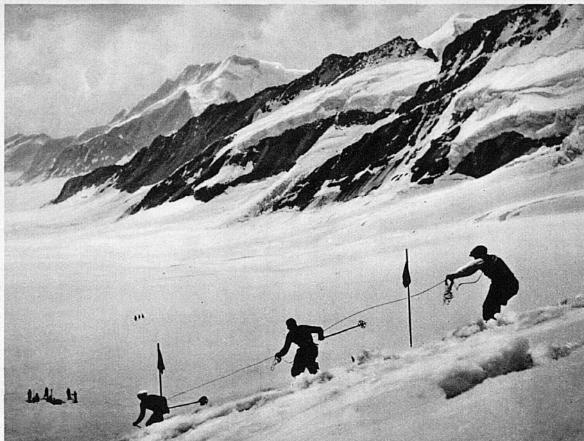
Seilfahren am Sommer-Skirennen auf Jungfrauoch — Ski à la corde au Jungfrauoch

Auf 3500 Meter Höhe bewahrt sich auch im hohen Sommer noch ein skigerechter Schnee. Die Schweizer Skischule Jungfrauoch bleibt auch während der glühenden Hundstage in Betrieb. Herrlich dehnt sich zwischen Berghaus und Konkordiaplatz das weite Abfahrtsgebiet. Hier führt die Schweiz alljährlich ihren Gästen mitten im Juli in einem einzigartigen Schauspiel die Freuden des Wintersports vor Augen. Dieses Jahr gelangt das Sommer-Skirennen am Jungfrauoch den 11. und 12. Juli zur Durchführung. Die Konkurrenzen — Abfahrtsrennen und Slalom für Damen und Herren am Samstag, Sprunglauf und Gruppenfahren am Seil am Sonntag — werden nach der internationalen Wettlaufordnung ausgetragen. Nicht nur die besten Schweizer, auch die bedeutendsten Skifahrer Deutschlands, Oesterreichs und Frankreichs messen sich auf dem ewigen Schnee. Das Sommer-Diavolezza-Abfahrtsrennen in Pontresina findet am 19. Juli, Abfahrtsrennen und Slalom auf dem Paneyrossaz-Gletscher bei Anzeindaz am 5. Juli statt.