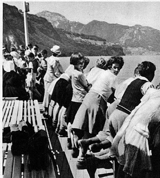
Mitten ins Bergland der Urschweiz auf dem windumspielten Deck — La croisière entre les montagnes