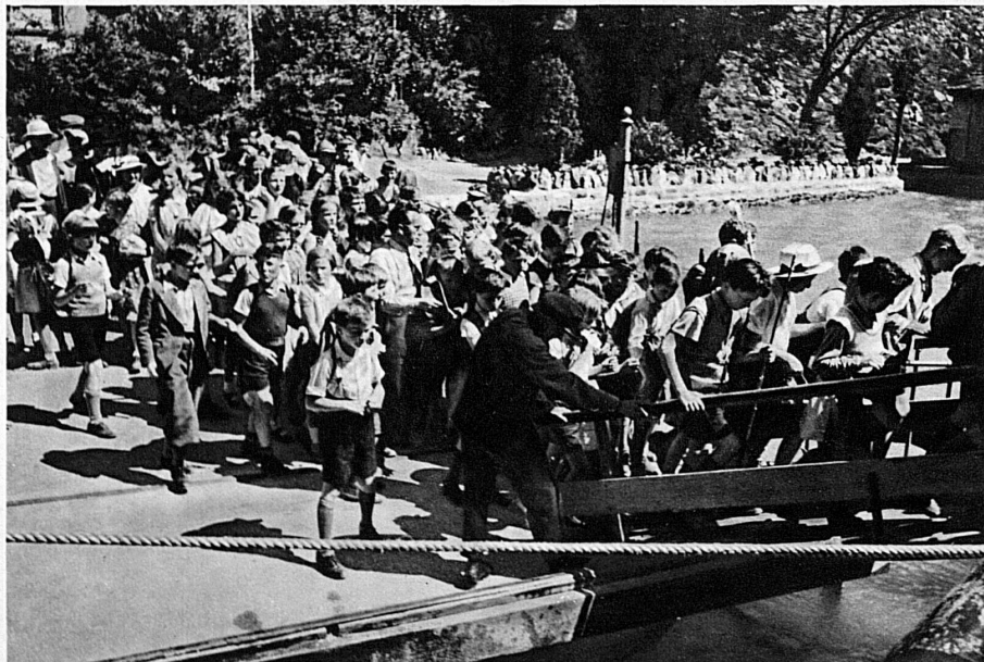
Nach dem Besuch der Tellschiffahrt zurück auf das Schiff — Une visite à la chapelle de Tell et l'on se rembarque