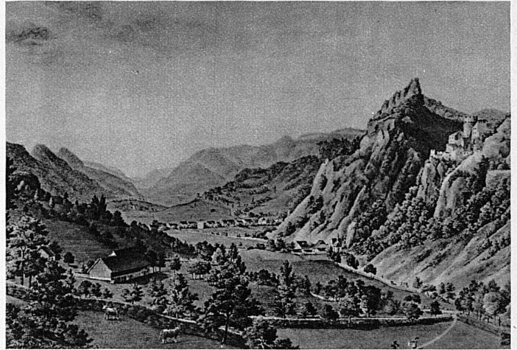
Balsthal dans le Jura soleurois, d'après une gravure de H. Aeschbach — Balsthal im Solothurner Jura, alter Stich von H. Aeschbach