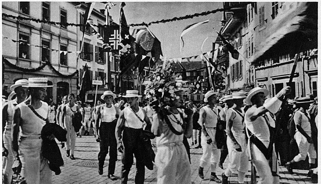
Cortège de la Fête fédérale de gymnastique d'Aarau — Der Festzug des Eidgenössischen Turnfestes in Aarau 1932