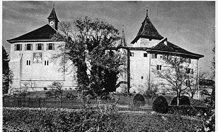
Château de Kybourg près Winterthur — Schloss Kyburg bei Winterthur