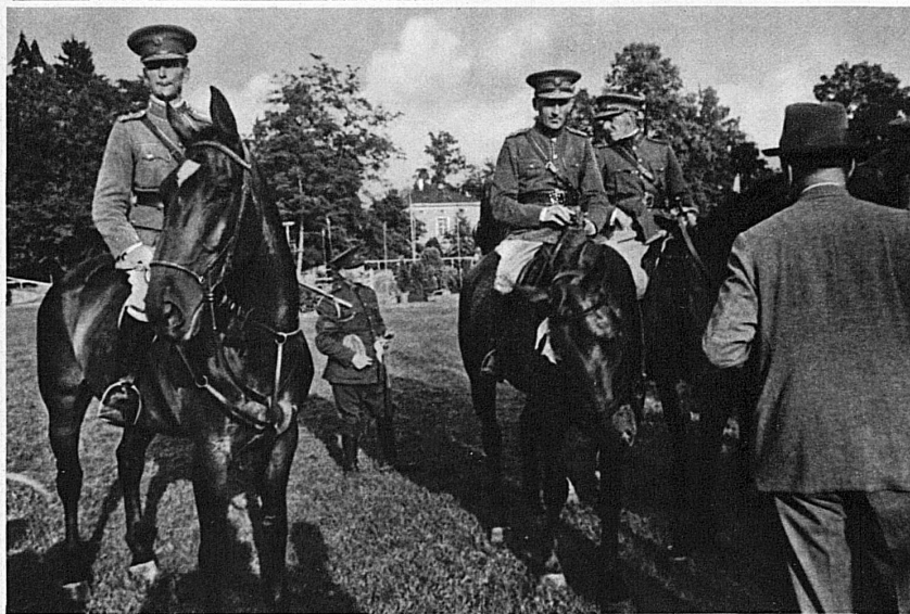
Bilder vom Internationalen Luzerner Concours Hippique 1935