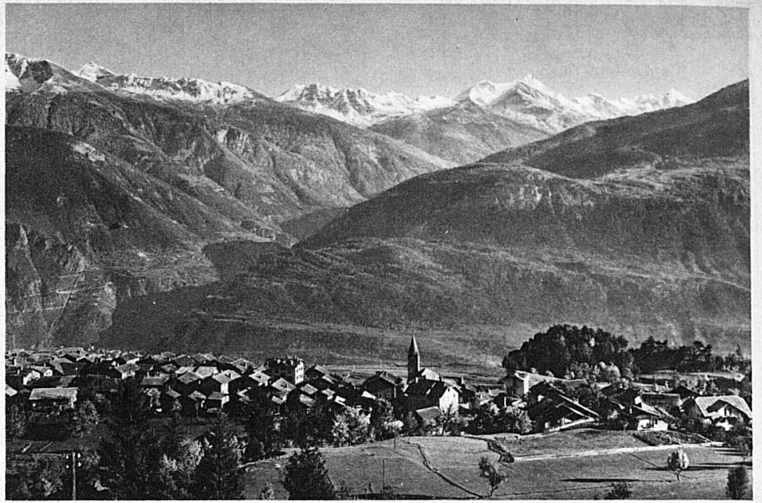
Montana und die Walliser Alpen – Montana et les Alpes valaisannes

Hier ist man zwischen den weitgespannten Walliser Kontrasten, zwischen der Rebe und dem Gletscher mitten innen. Steigt man zu Tal, ist der kurze Weg mit der Berg-