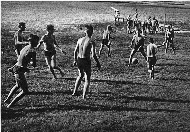
Erholung beim Spiel – Ça, c'est du sport!

Jura, Mittelland, Alpen und Tessin, grösste Gegensätze, grösste Mannigfaltigkeit der Landschaft und Kultur und doch ein Ganzes, eine Einheit, ein Begriff, der keinem fremd ist, Inbegriff grossartiger Natur: die Schweiz. Berge, aus dem dunkeln Blau der Wälder aufsteigend, zartgrün, beinahe silberschimmernd in ihrer sonnigen Weidenregion, mit Gletschern, schroffen, schwärzlichen Felsenwänden und mit Firnen ewigen Schnees zum Himmel ragend. Nicht Berge nur, Täler, von der Gletscherzunge bis zum See von Wasserfällen, Bächen, Flüssen rauschend, von Schienenwegen, stahlblauen Autostrassen, weissen Strässchen und im Grün verborgenen Wanderpfaden kreuz und quer durchzogen. Grosse Kurorte mit Hotels, Musik und einem farbenfrohen Treiben. Holzbraune Dörfer mit weissen Kirchtürmen. Dörfer, erfüllt vom würzigen Geruch des Heus und des Getreides. See- und Flussufer mit Weinbergen und mit üppigen Gärten. Türmreiche Städte, Dörfer, Villen, Schlösser. Hügelland und Ebene mit grossen Ackerbreiten und belebten Industriegebieten. Volk vieler Sprachen mitten in Europa, eine kleine eigenartige Welt: die Schweiz.