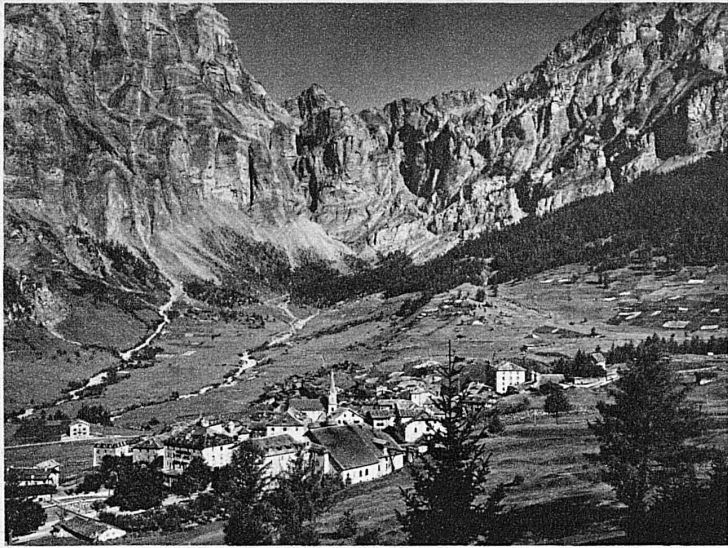
Leukerbad im Wallis – Loèche-les-Bains