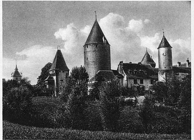
Das stolze Schloss Estavayer unweit von Bad Yverdon – Le château d'Estavayer non loin d'Yverdon-les-Bains sur le lac de Neuchâtel