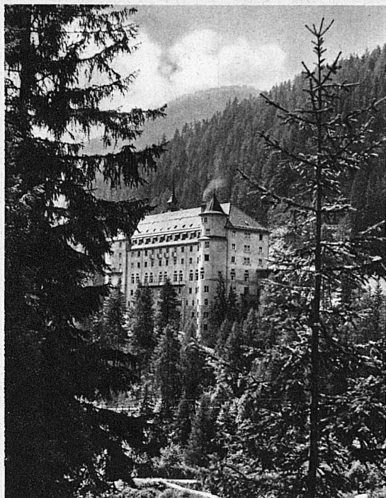
Val Sinestra (Engadine)

Ragaz compte 5 établissements de bains principaux, alimentés par la source de Pfäfers qui débite de 4 à 10,000 litres/min. 90 bains particuliers et la grande piscine servent au traitement que renforce la cure d'eaux.