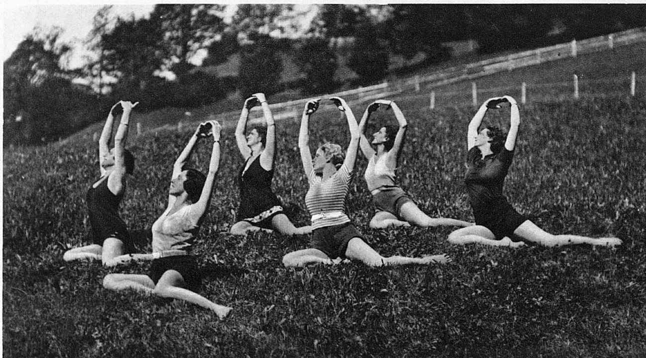
Freiübungen im Bad Weissenburg – Exercices en plein air