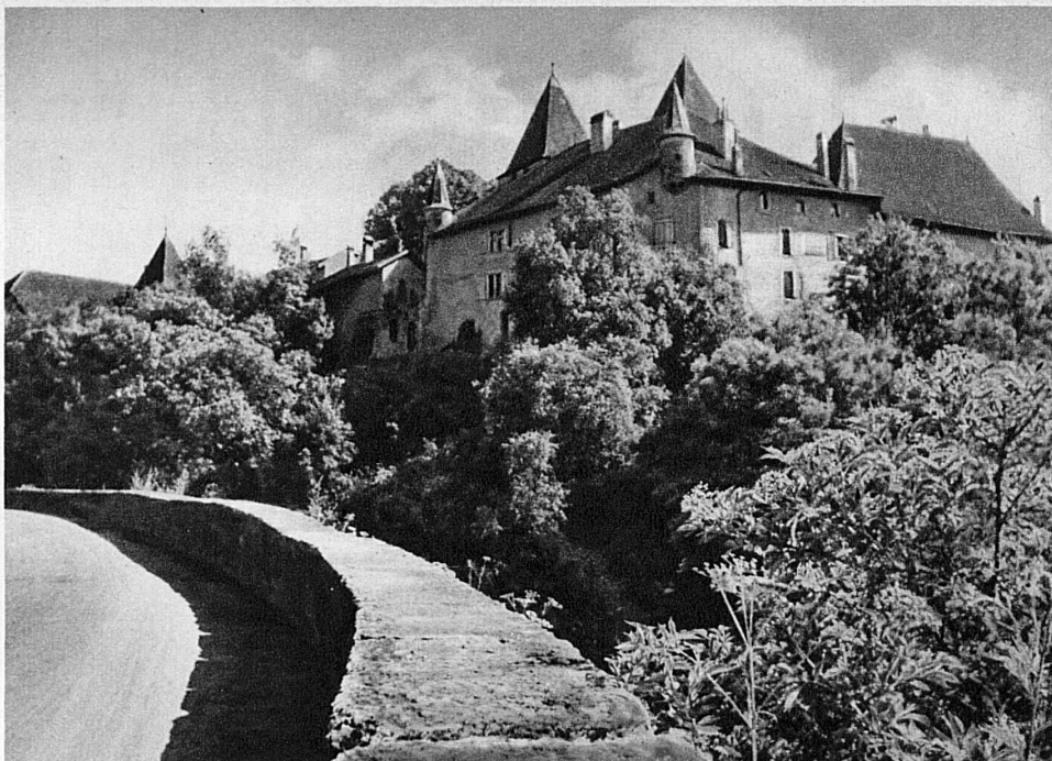
Le vieux castel de La Sarraz, sur la route de Pontarlier-Lausanne, abrite le Musée romand et des congrès de poètes et d'artistes modernes