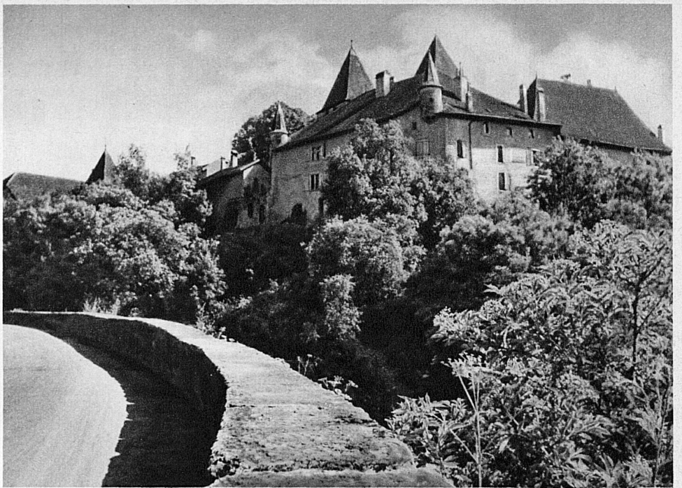
Le vieux castel de La Sarraz, sur la route de Pontarlier-Lausanne, abrite le Musée romand et des congrès de poètes et d'artistes modernes