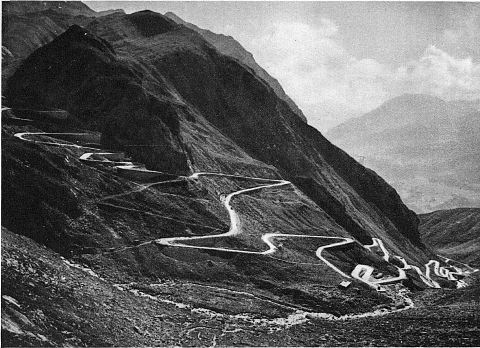
Die Gotthardstrasse führt durchs Herz der Schweiz vom Vierwaldstättersee über den altberühmten Passberg in den Tessin

Z weifach trennen die Schweizer Hochalpen Nord und Süd. Rhone und Rhein gruben in den Wall ihre tiefen Täler ein. Im Quellmassiv, im Gotthard nur, vereinigen sich die beiden Mauern zu einer Bastion.