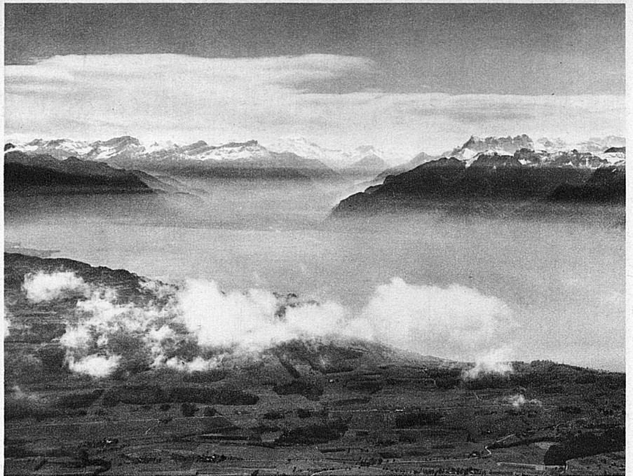
Über dem Gros de Vaud schon öffnet sich in der Flughöhe der Blick über die gewaltige Flut des Genfersees, und weit reicht er hinein in die Gipfelwelt des Mont-blancmassivs, der Dent du Midi und der Walliser Alpen

Die Fluggesellschaft «Alpar» hat den Zweck, die Städte Bern, Lausanne, Biel und La Chaux-de-Fonds/Le Locle an die Eckpunkte des internationalen Luftverkehrs der Schweiz, Zürich, Basel und Genf, anzuschliessen. Neuerdings hat sie noch die wichtige Aufgabe übernommen, die schweizerische Quer-Verbindung Genf—Zürich zu sichern.