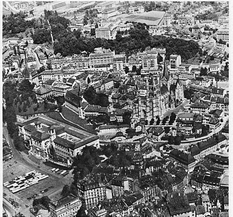
Weniger eindeutig und klar, aber hochinteressant ist auch das Bild des Stadtkerns von Lausanne. Im Mittelpunkt die Kathedrale und der älteste Häuserring, der unmittelbar übergeht in die Bauart der neuesten Zeit

Das Netz der «Alpar» erstreckt sich über eines der vielseitigsten und landschaftlich reizvollsten Gebiete Europas: Die «Alpar»-Linien folgen hart dem Alpenwall. Sie führen über die schweizerischen Seen, über das fruchtbare Mittelland, über die Kämme des Jura, über zahlreiche Städte und Ortschaften... Ein Flug mit der «Alpar» bedeutet nicht nur eine rasche und bequeme Fahrt, sondern einen Reisegenuss, wie er abwechslungsreicher kaum geboten werden kann.