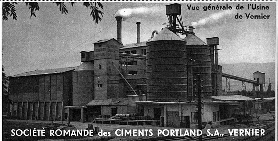
Vue générale de l'Usine de Vernier

SOCIÉTÉ ROMANDE des CEMENTS PORTLAND S.A., VERNIER