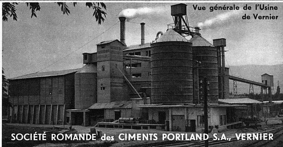
Vue générale de l'Usine de Vernier

SOCIÉTÉ ROMANDE des CEMENTS PORTLAND S.A., VERNIER