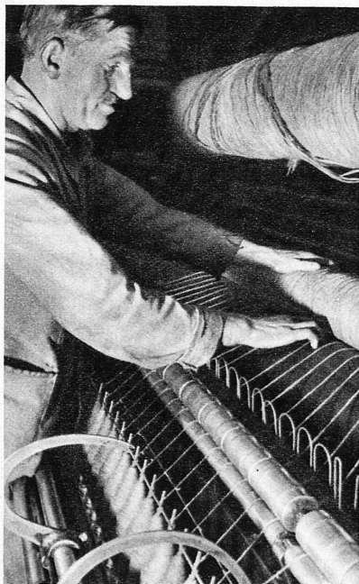
Schweizer Arbeit, Schweizer Produkt in der Textilfabrik Industrie suisse, produits suisses dans les fabriques textiles

Besuchen Sie auch die herrlichen Basler Museen und den Zoologischen Garten!