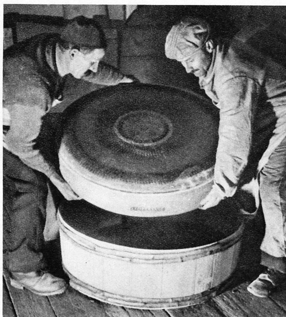
Exportkäse wird verpackt – Le fromage qui doit être exporté est emballé