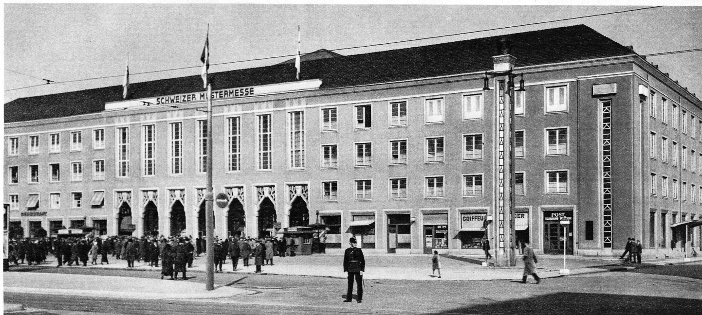
Entrée principale du grand bâtiment de la Foire d'échantillons à Bâle