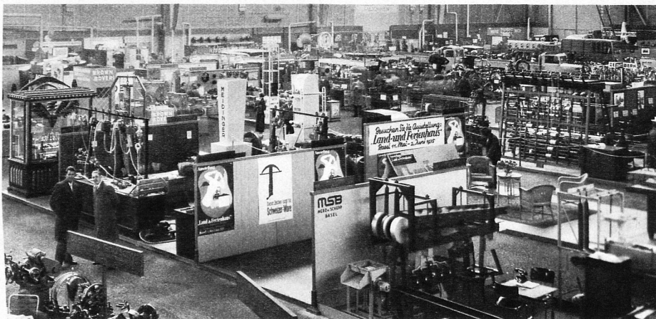
Werkzeugmaschinen u. Holzbearbeitung – Machines à fabriquer les outils et travaux en bois

La faveur est accordée pour les billets de simple course pris pendant la période du 16 au 28 avril. La durée de validité de ces billets sera de 6 jours; le retour devra toutefois être effectué le 30 avril au plus tard, de sorte que la durée des billets délivrés les 26, 27 et 28 avril ne sera que de 5, 4 ou 3 jours. La facilité de transport n'est pas accordée aux enfants de 4 à 12 ans.