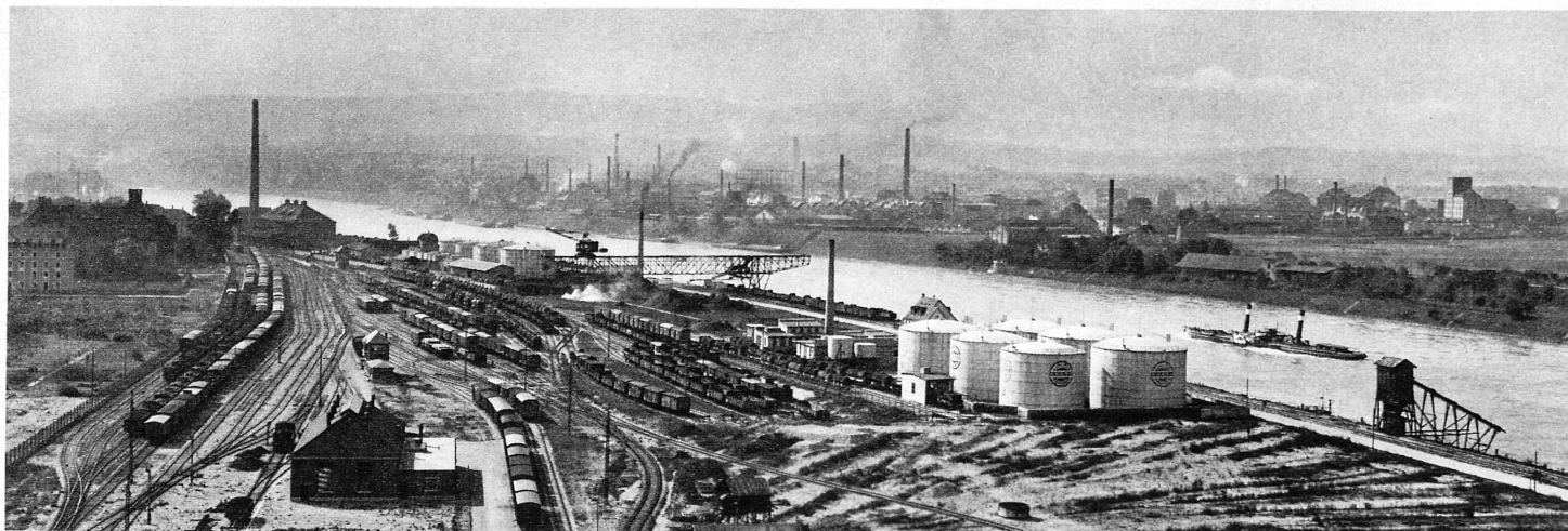
Der Basler Rheinhafen – Les ports de Bâle au bord du Rhin

Grossbetrieb am Bahnhof, festliche Stadt, bewimpelte Strassenbahn, Auto an Auto auf dem Asphalt, milder Frühling in der Luft, Reisezeit ... in Basel ist Mustermesse.