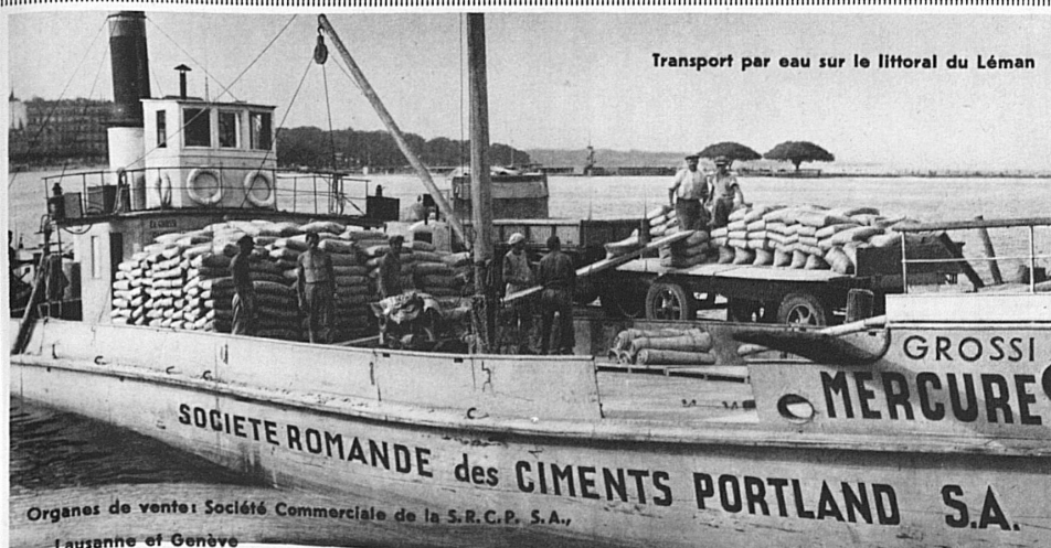
Transport par eau sur le littoral du Léman

Behördlich patentierte Generalagentur für Passage u. Auswanderung Platzbelegung auch durch sämtliche patentierten Reisebureaux