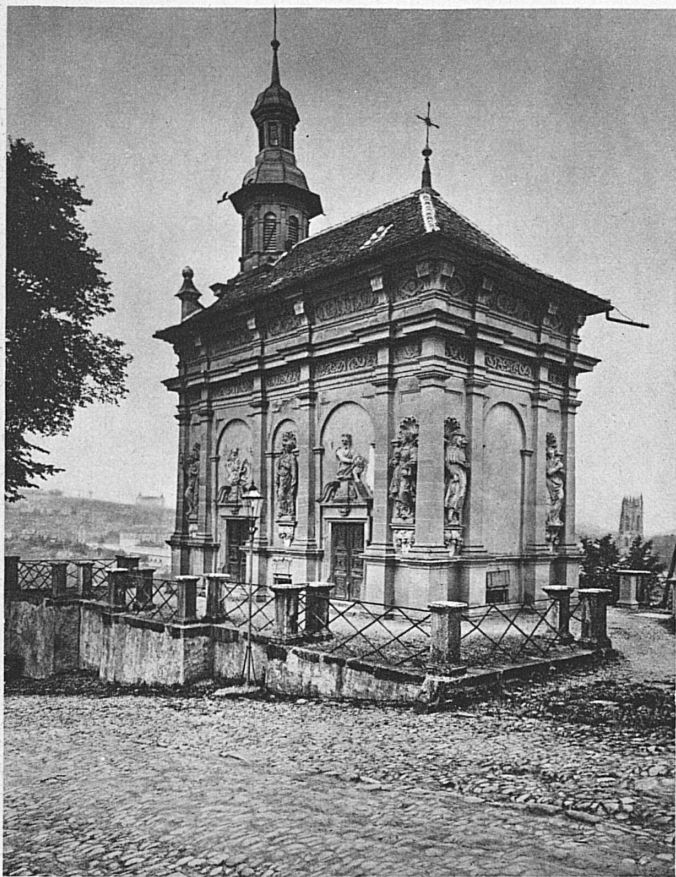
Loretokapelle in Freiburg. Reizvoller Frühbarockbau von Hans Franz Reyff, 1647/1650