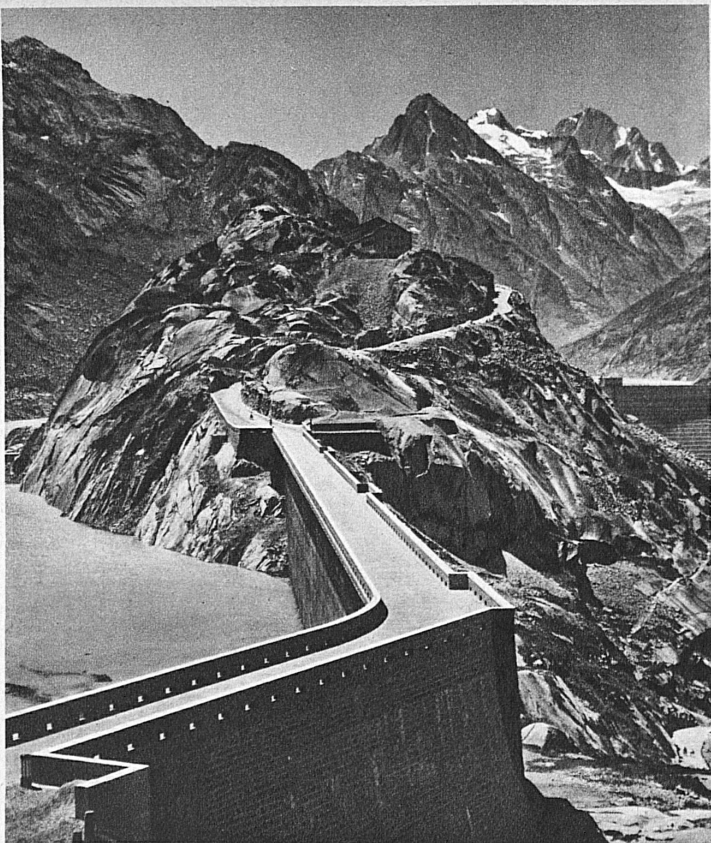
Ist dies ein Stück der chinesischen Mauer? Nein, die Grimsel-Seeferrugg Une vue de la grande muraille de Chine? Non, tout simplement le barrage Grimsel-Seeferrugg

Den träumerischen Ernst der nordischen verbindet die Schweiz mit dem heitern Zauber der südlichen Landschaft.