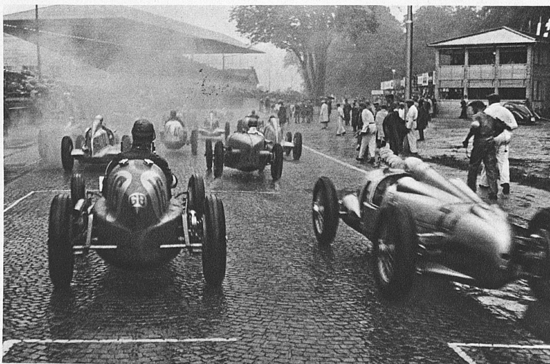
Der 1. Grosse Preis der Schweiz in Bern 1934 Le 1 er Grand Prix Automobile de Suisse Berne 1934

Das kleine Land zeigt bei jeder Biegung der Strasse eine neue Seite in seinem unerschöpflichen Bilderbuch: ein kleines mittelalterliches Städtchen, den Ausblick auf die Alpengipfel, Seen und romantischen Schluchten, zum Baden einladende herrliche Gestade, unberührtes Volksleben, ländliche Herbergen und daneben die allerbequemsten und modernsten Hotels.