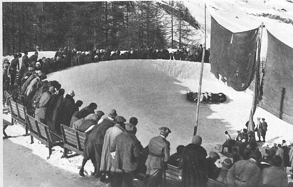
Le virage de Simmy Corner, piste du championnat mondial