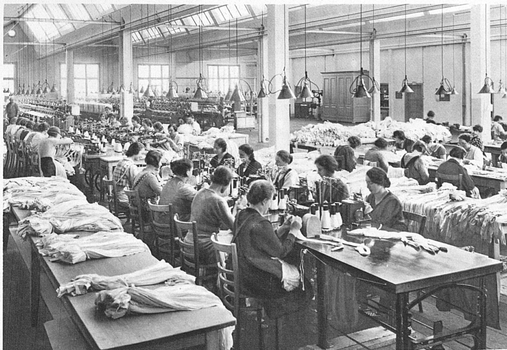
Arbeitsaal der Wirkerei-A.G. Uster (Kt. Zürich) « Elbeo » Strumpffabrik - Workroom in the Wirkerei A.G. Factory at Uster (Canton Zurich); « Elbeo » Stocking Factory

Switzerland possesses practically no mineral resources. Her raw materials have to be imported — a severe handicap in these days of keen competition. Thus Swiss manufacturers, if they are to find a market for their goods abroad, are compelled to concentrate on quality. The result is that Switzerland has become a producer of high-grade goods. Her industries had to be equipped with the finest and most accurate tools, the most efficient machines obtainable; cheap power and skilled labour had to be provided. Even in the days when our modern means of transport were still unknown, the peace and security for which Switzerland has always stood enabled her to develop a number of industries in which mental concentration, technical skill and practical experience were essential factors. Then came the age of rapid transport. Switzerland found herself able to compete even with nations possessing their own raw materials. The introduction of electrical power soon followed, when an invaluable, neverfailing source of energy was found and the huge masses of water from Alpine glaciers were harnessed to the service of humanity.