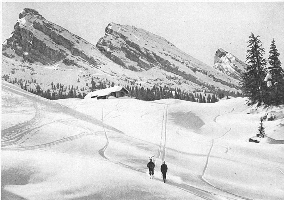
Toggenburger Skigebiet Sellenmatt-Unterwasser Die Churfürsten

25 ereignisreiche Jahre: sie umfassen die Kriegezeit, die Nachkriegszeit und die gewitterhafte Krisenzeit. Trotzdem wird mit grosser Tatkraft die Strecke ausgebaut. 1930—1932 wird die Linie elektrifiziert. Mit Motorwagenzügen wird der Betrieb aufgelockert und den Bedürfnissen angepasst. Die Bahn stellt sich in den Dienst des Wintersports. Sie nimmt von den SBB die Toggenburger Strecke Wattwil—Ebnet-Kappel in Pacht. Gleichermassen dient sie drei Bestimmungen: dem Lokalverkehr, dem Verbindungsverkehr zwischen grossen Linien und dem Touristenverkehr. Und mit dieser dreifachen Aufgabe tritt sie mit berechtigtem Optimismus ins zweite Vierteljahrhundert ein.