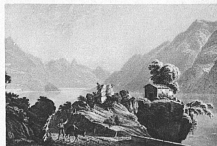
Luganersee gegen Porlezza, nach einem alten Stich

Im sonnigen Tessin sind Kunstschatze aus den verschiedensten Epochen erhalten geblieben. In wundervoller Weise verbinden sich hier alte Baudenkmäler und historische Stätten mit dem Bilde der Landschaft. Wenn wir eine der interessantesten Strecken der Gotthardbahn, nämlich die Biaschina-Schlucht, durchfahren haben, erblicken wir in dem Dörflein Giornico die Kirche San Nicolao, welche die schönste Fassade der romanischen Kirchen des Tessins besitzt. In Bellinzona zeigt die Kollegiatkirche eine stolze Barockfassade, während die Kirchen San Biagio und Santa Maria delle Grazie hervorragende mittelalterliche Bauten mit wertvollen Fresken sind. Einzigartig ist das Gesamtbild der historischen Befestigungen von Bellinzona mit den drei stolzen Kastellen Uri, Schwyz und Unterwalden, von denen das mittlere, hoch über der Altstadt auf-