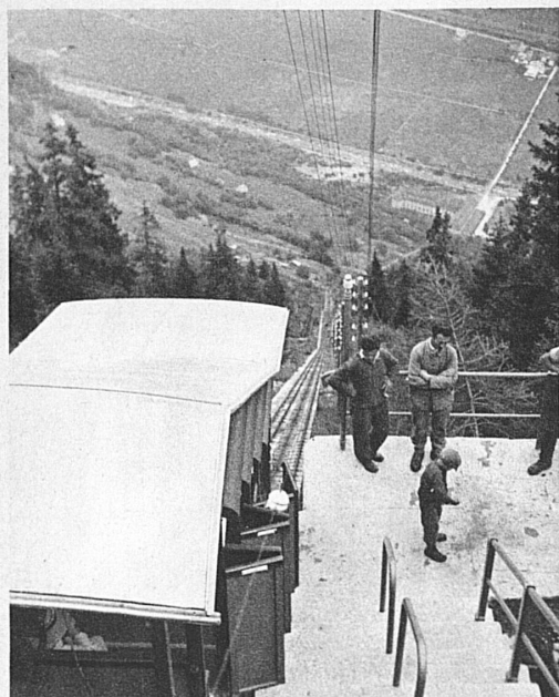
Funiculaire du Ritom sur Piotta (Léventine)

S'il vous est jamais arrivé de maudire le progrès qui banalise tout, et qui dans les cases montagnardes a pendu ses ampoules à la place où grésillait la lampe à beurre, vous pardonnerez là-haut à l'électricité, qui si complaisamment nous conduit par un bout de fil à ses sources, dans l'ineffable sérénité des hauts alpages, et nous rend ici au centuple la paix qu'elle nous a ravie à la ville.