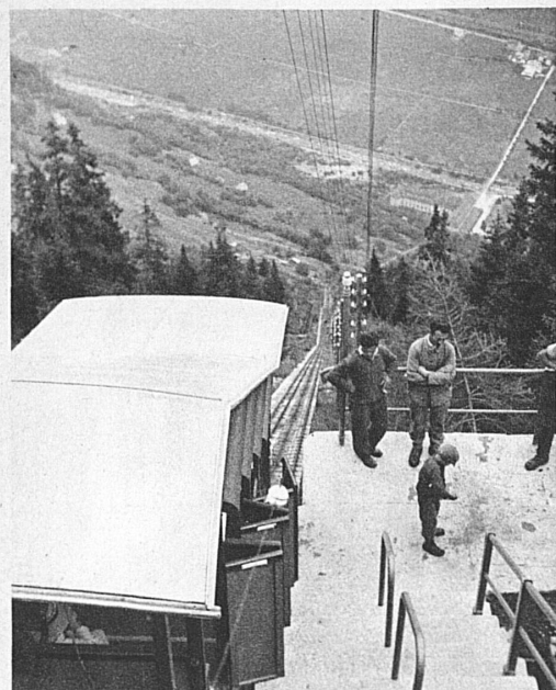
Funiculaire du Ritom sur Piotta (Léventine)

S'il vous est jamais arrivé de maudire le progrès qui banalise tout, et qui dans les cases montagnardes a pendu ses ampoules à la place où grésillait la lampe à beurre, vous pardonneriez là-haut à l'électricité, qui si complaisamment nous conduit par un bout de fil à ses sources, dans l'ineffable sérénité des hauts alpages, et nous rend ici au centuple la paix qu'elle nous a ravie à la ville.