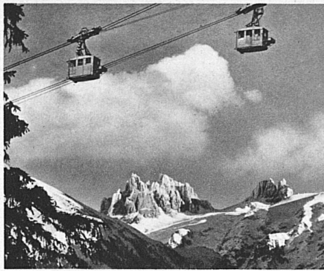
Luftseilbahn Gerschnialp-Trübsee mit Spannörter