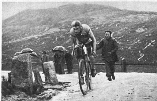
Dans les lacets du Saint-Bernardin

Le lendemain, une rude promenade les conduira, de la Cité Internationale à Berne, par Yverdon, le Val de Travers, le Locle, La Chaux-de-Fonds, la Vue des Alpes et Neuchâtel.