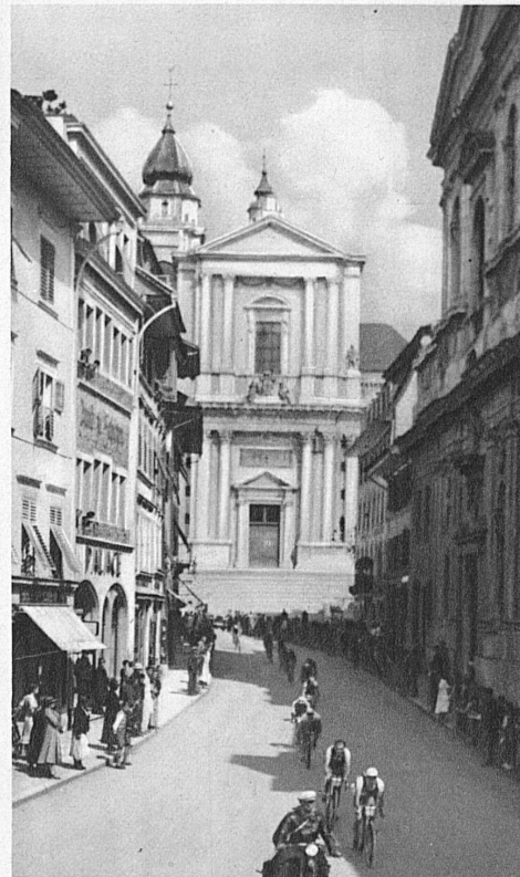
Traversée de Soleure

saisissante Axenstrasse, le Chemin Creux et l'arrivée triomphale à Lucerne.