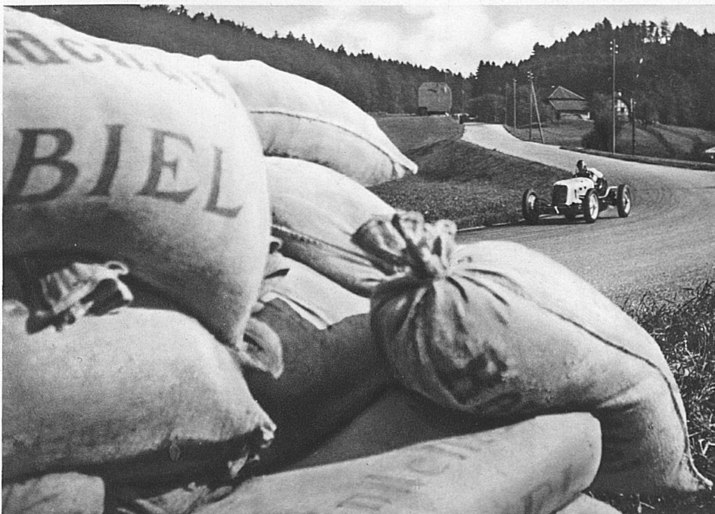
Les sacs de sable protecteurs