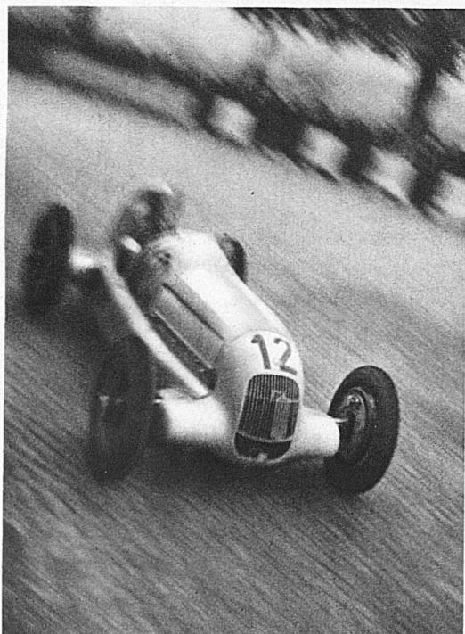
En pleine course