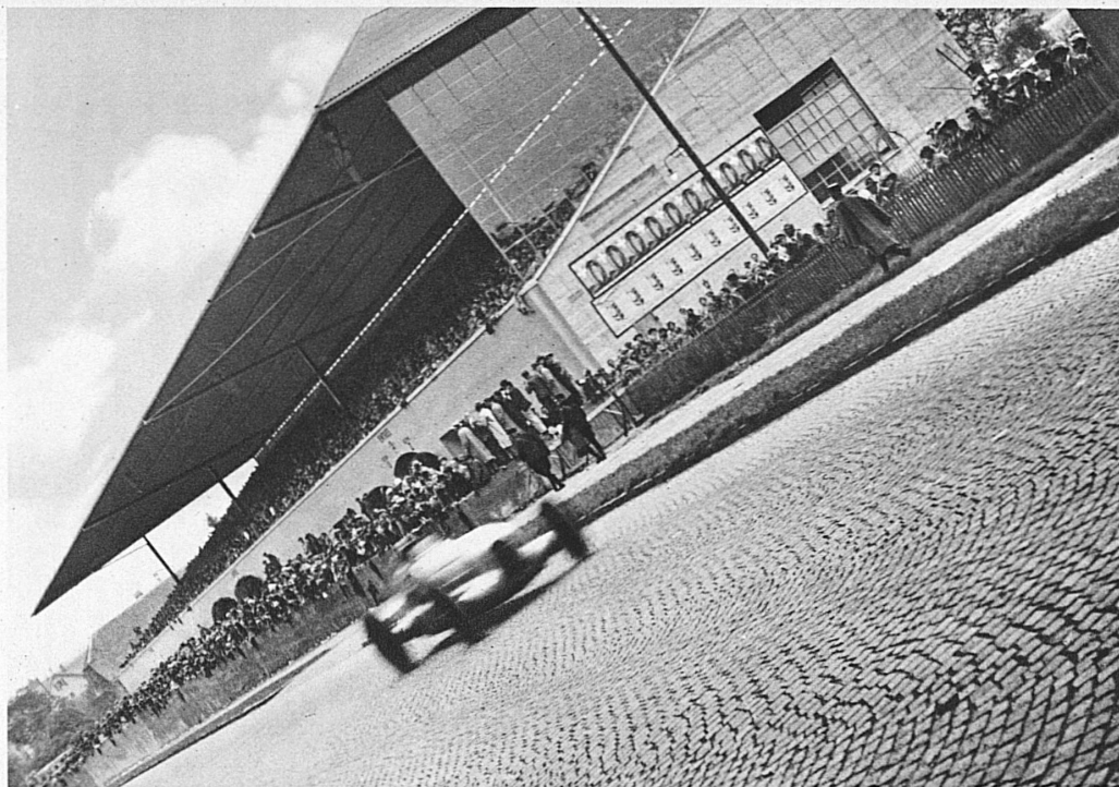
Les grandes tribunes au virage de Bremgarten