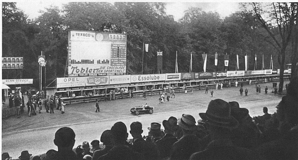
Coup d'œil depuis les tribunes centrales sur la piste et le tableau d'affichage