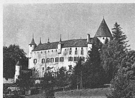
Schloss Oron in der Waadt

Installationsmaterial für elektrische Freileitungen • Krane aller Art und Verladeanlagen • Baumaschinen • Transportanlagen • Schützen für Stauwehre und Turbinenanlagen