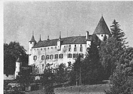
Schloss Oron in der Waadt

Construction de lignes aériennes de haute et basse tension et de lignes de contact pour chemins de fer