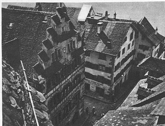
Die Kleinstadt mit ihrer Romantik hat den ganzen Zauber der Wanderburschenzeit bewahrt. Zug mit seinen alten Häusern und Gassen