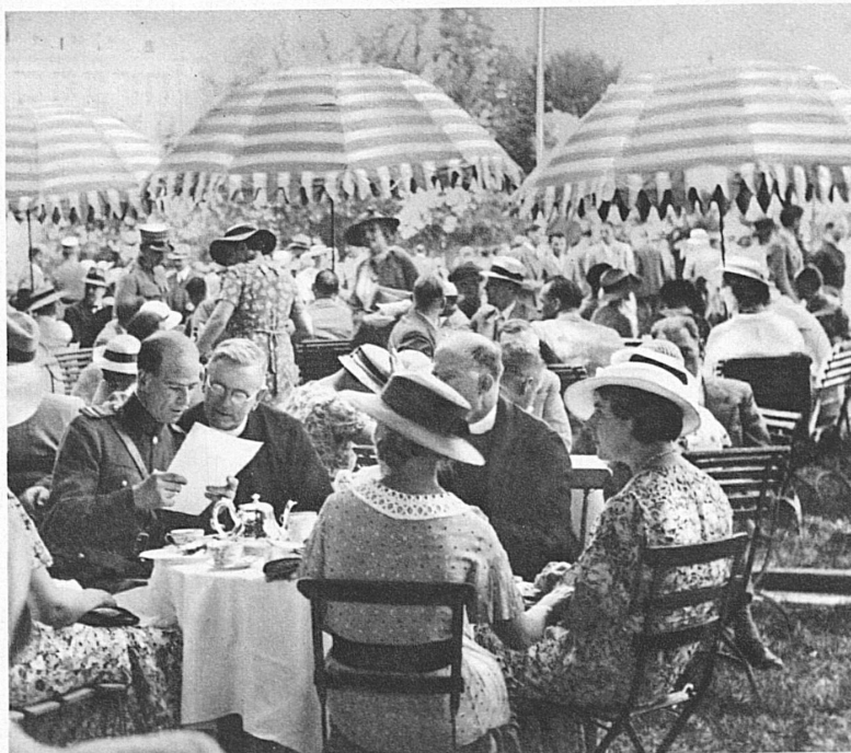
Das Tribünenbuffet während der Pause