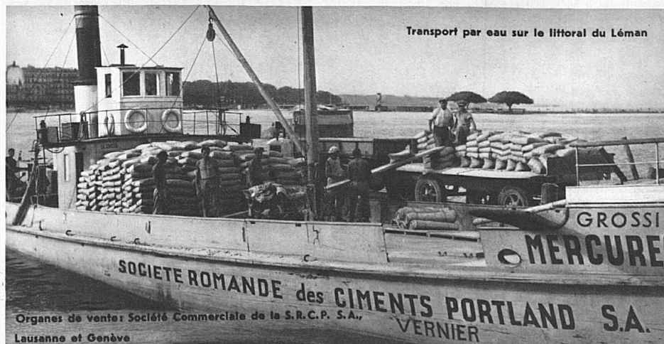
Transport par eau sur le littoral du Léman

Organe de vente Société Commerciale de la S.R.C.P. S.A., Lausanne et Genève