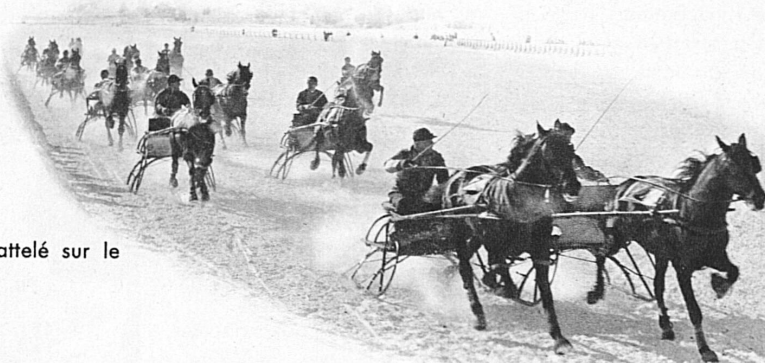
Course de trot attelé sur le lac de St-Moritz