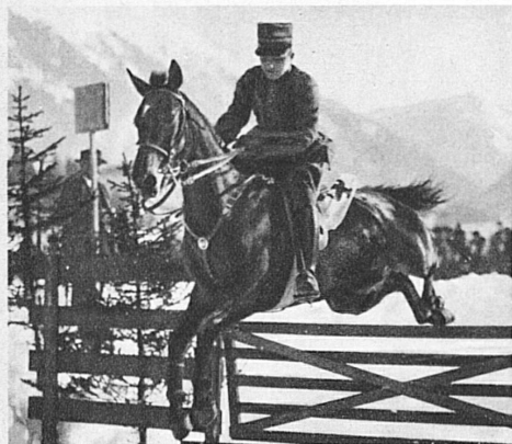
Concours hippique à Gstaad

Lors de la fondation de la Fédération Suisse des Sports Hippiques en 1900, on ne connaissait en Helvétie que les courses de chevaux sur le gazon; les courses de Lucerne jouissaient d'une réputation internationale, d'autres villes voyaient les courses nationales prendre un bel essor. St-Moritz à son tour, dans la belle Engadine, devenu l'un des premiers centres mondains d'hiver en Europe, se décida, voilà une vingtaine d'années, à transformer son lac gelé et enneigé, donc inutile, en une piste de courses. L'initiative des pionniers de St-Moritz fut couronnée d'un franc succès. Les courses internationales en plat et au trot y ont pris une telle extension, qu'une semaine suffit à peine à faire courir toutes les épreuves. La participation des écuries de courses des grandes capitales européennes est devenu toujours plus nombreuse. Les 24 mes Courses de St-Moritz s'y dérouleront cette année les 27 janvier, 31 janvier et 3 février , sous le haut patronage de M. le Président de la Confédération, le Colonel Minger, Chef du Département militaire fédéral, qui vient de fonder un magnifique Challenge pour le Grand Prix des officiers, ouvert aux officiers suisses et aux officiers des Etats étrangers accrédités auprès