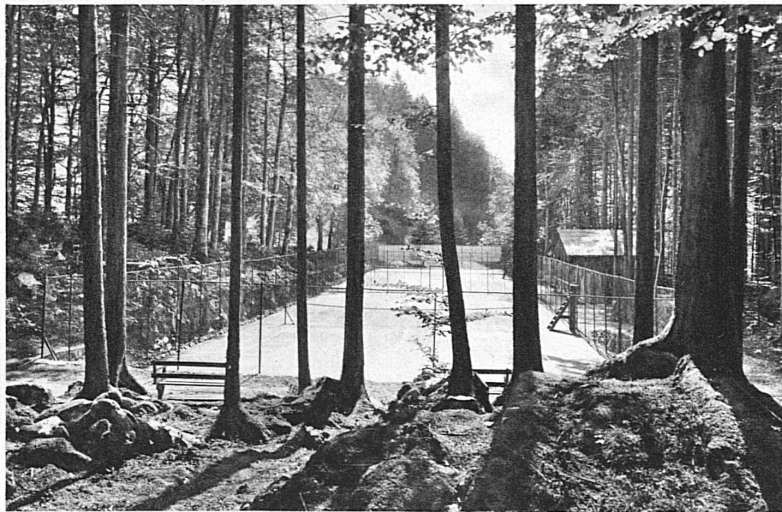
Campo di tennis a Axenstein, Lago dei Quattro Cantoni