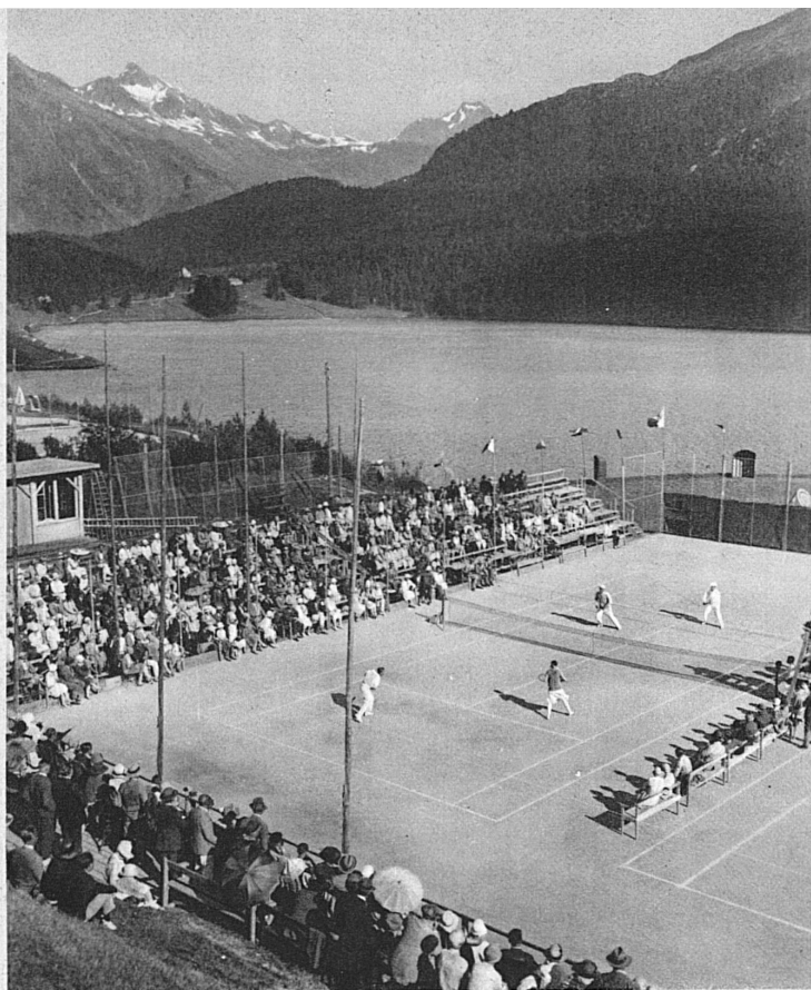
Torneo di tennis a St. Moritz