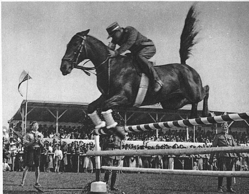
Barrierenspringen auf dem Rennplatz in Frauenfeld

Vom 26. bis zum 30. Juni wird in Thun der 17. Nationale Concours Hippique abgehalten werden. Es ist dies die grösste reiterliche Veranstaltung der Schweiz, abgesehen von den zwei internationalen Konkurrenzen in Luzern und Genf. Wäh-