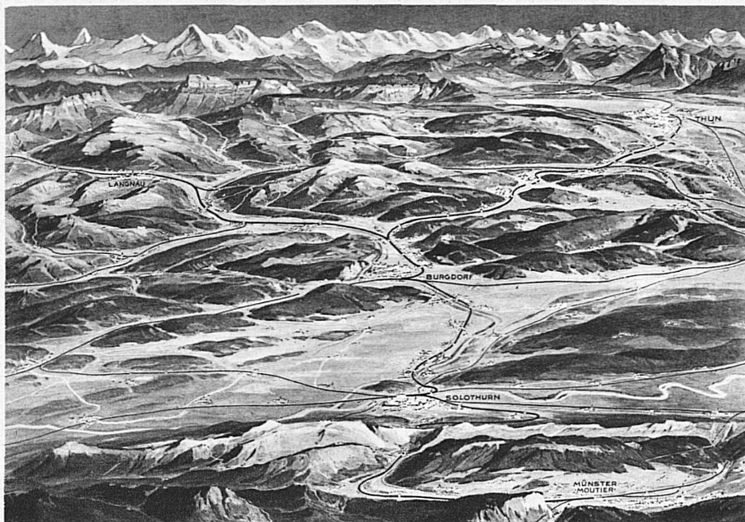
Blick von den Jurahöhen des Weissensteins nach Süden – Ausgangspunkte: Stationen Günsbrunn und Oberdorf (Solothurn) – Autokurs Günsbrunn-Weissenstein. Sonntagsbillette zu reduzierten Preisen

Wie die Kunstturner und die Leichtathleten werden nun auch die Nationalturner ihre Meisterschaftswettkämpfe haben. Erstmals am 2. Juni 1935 soll in Luzern je ein Meister ausserkoren werden im Gruppewettkampf in Kategorie A und B, im Einzelzahnkampf und in den Spezialübungen Steinstossen aus Stand und mit Anlauf, im Hochweitsprung und in den Freibungen. Die grösseren Unterverbände stellen eine Gruppe von 13 Mann in Kategorie A. Die