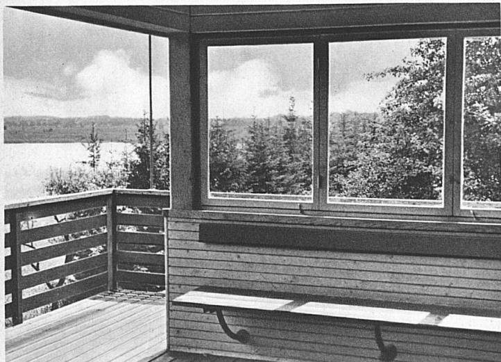
Sonne und Weite