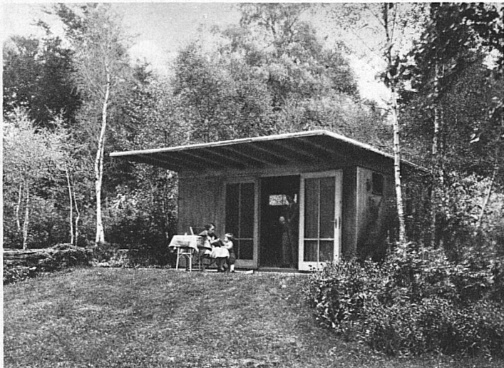
Weekendhaus. Zügarpark 1933. Vorderfront

Der Maschinenlärm und die Benzinluft der grauen Großstädte machen eine zeitweilige Flucht ins Freie unerlässlich, soll nicht der Körper, an den der Geist nun einmal gebunden ist, allmählich zugrunde gehen. Ein Stück eigene Erde, Bäume, die wir pflanzen und die mit uns und unsern Kindern wachsen und älter werden, ein Sonnenplätzchen, wo wir allein sein können, wenn wir wollen, und wo wir Gäste mit selbstgezogenen Blumen und Früchten verwöhnen können, wenn wir Lust dazu haben, ein Ort, wo wir Tiere halten können, wo Wetter und Jahreszeiten