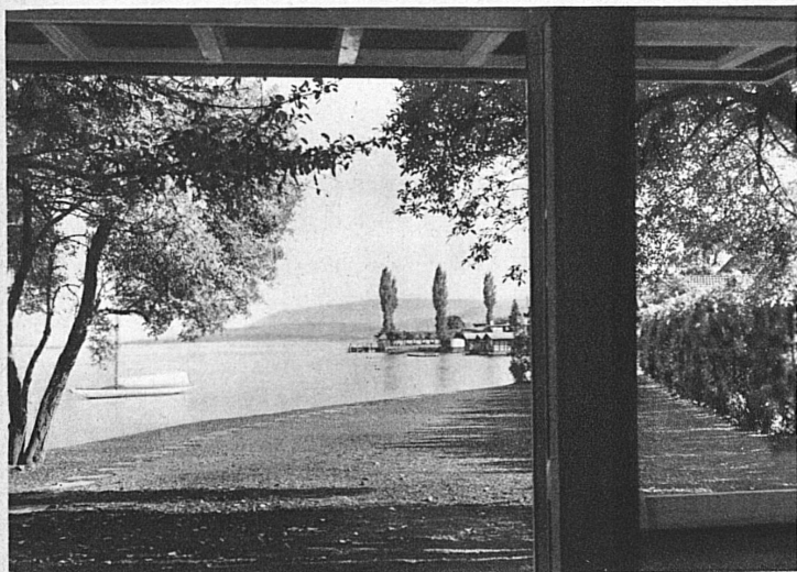
Parkhaus. Rüschtikon a/See

Ausstellung in Basel 11. Mai bis 2. Juni