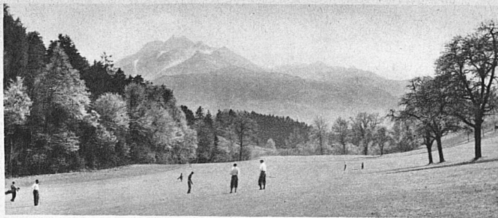
On the fairway at Lucerne Links; Pilatus in the background