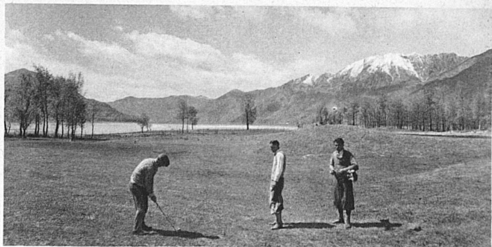
Ascona Golf Links on Lago Maggiore