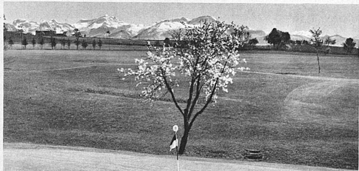
No. 8 on the Lausanne course. He must be a bad golfer indeed whose play does not respond to such surroundings.