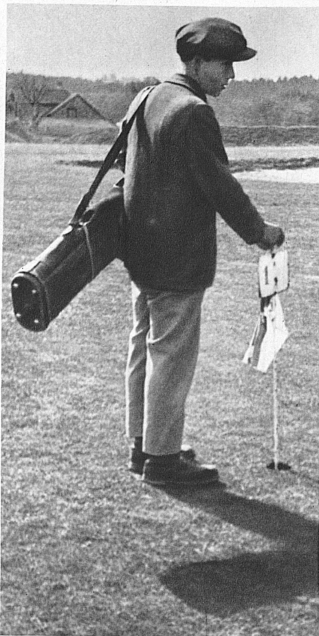
Caddies are the same everywhere — cheerful on the fairway, born pessimists on the green