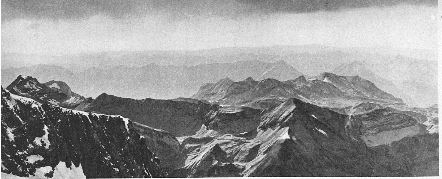
Blick vom Jungfraujoch nach Norden. Die Schweizer Skischule Jungfraujoch ist bis in den späten Sommer hinein in Betrieb; sie wird geleitet vom Schweizer Skimeister Fritz Steuri