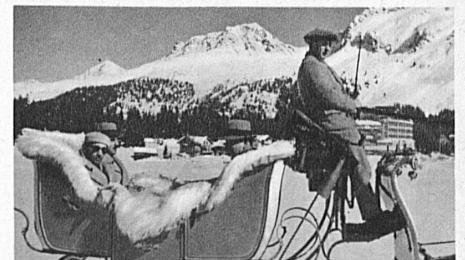
Prinz Nawab Muazzam Jah Bahadur von Hyderabad in Arosa

Der Zweck der Seva-Lotterie ist gemeinnützig. Der Reingewinn dient der Arbeitsbeschaffung aller Art, der Förderung des Fremdenverkehrs, dem Naturschutz und ähnlichen Zwecken. Die Lotterie ist vom Regierungsrat des Kantons Bern bewilligt, und ihre Durchführung ist wiederum garantiert durch die Kantonalbank von Bern.