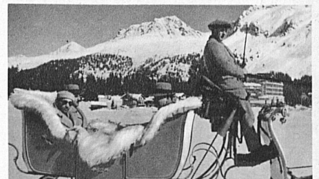
Prinz Nawab Muazzam Jah Bahadur von Hyderabad in Arosa

Der Zweck der Seva-Lotterie ist gemeinnützig. Der Reingewinn dient der Arbeitsbeschaffung aller Art, der Förderung des Fremdenverkehrs, dem Naturschutz und ähnlichen Zwecken. Die Lotterie ist vom Regierungsrat des Kantons Bern bewilligt, und ihre Durchführung ist wiederum garantiert durch die Kantonalbank von Bern.