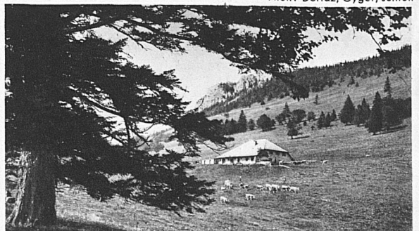
Chalet « des Crébillons » und Aiguilles de Baulmes, eine typische Juralandschaft bei Orbe

und schönen, erfrischenden und beglückenden Gegenden sind ja nicht dafür geschaffen, bloss als illustriertes Lehrbuch des Französischen zu dienen. Auch unser geistiges Vokabular erfährt im Welschland lebendige Bereicherung. In dem klassischen Lande der Töchterpensionate wird nicht nur ein feiner Sprachgeist gepflegt, sondern auch eine zivile Lebensart, die den alltäglichen Dingen eine graziöse Form zu geben vermag. Nicht nur die jungen Mädchen, die aus der ganzen Welt am Neuenburgersee und am Genfersee zusammenkommen, empfangen hier bleibende Eindrücke von kultivierter Geselligkeit und werden mit all den kleinen Dingen vertraut, die nun einmal zur gesellschaftlichen Gesittung gehören. Sondern auch unsere Gymnasiasten und Handelsschüler, unsere kräftigen Repräsentanten der Flegeljahre und des Naturburschentums werden während