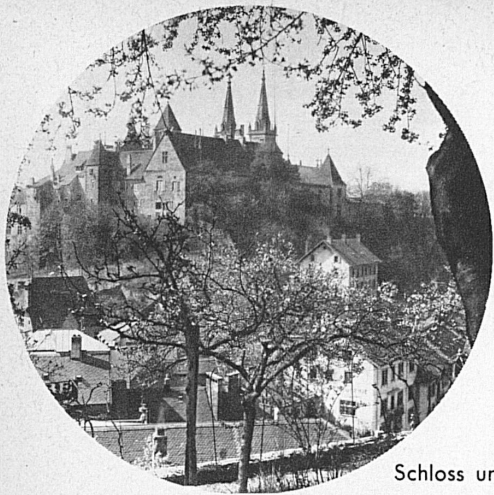
Schloss und Stiftskirche in Neuenburg