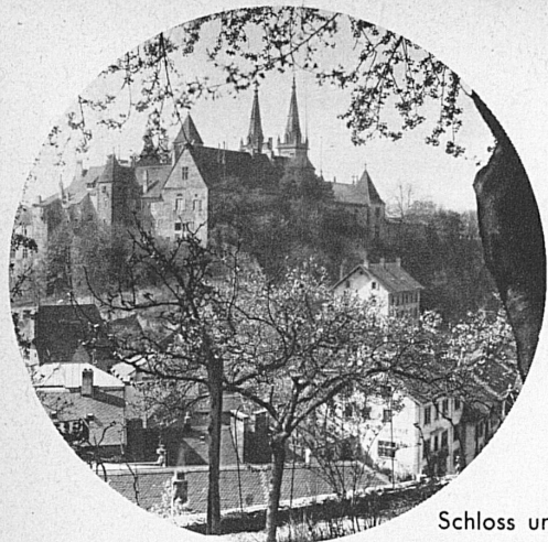
Schloss und Stiftskirche in Neuenburg