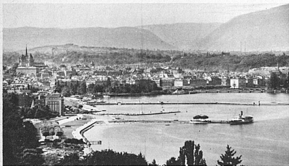
Genf und seine schöne Seebucht