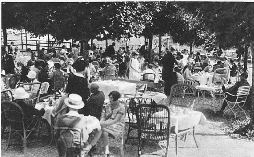
Villars à l'heure du thé