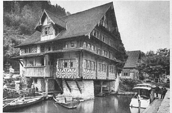
L'auberge de Treib (Quatre-Cantons)