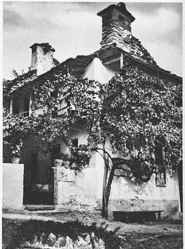
Une taverne à Orselina