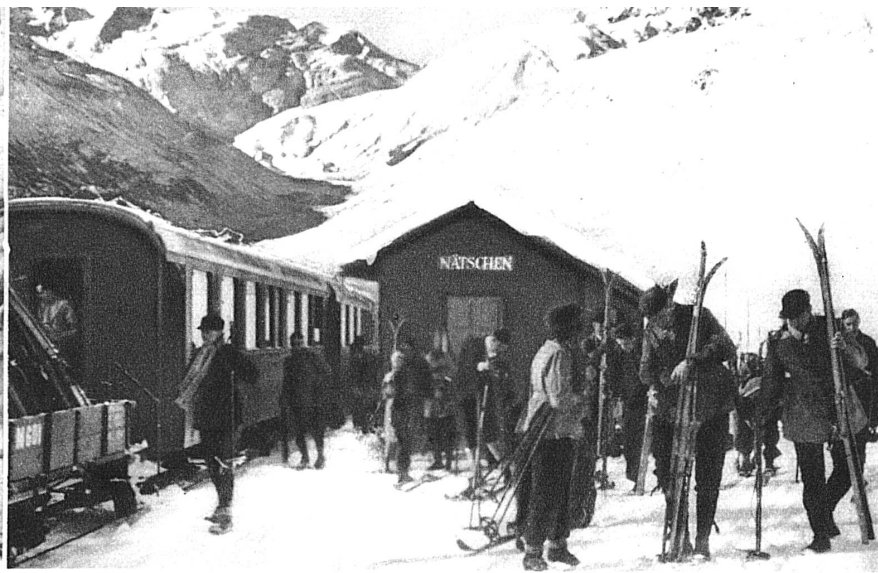
Nätschen! Alles aussteigen!! — Naetschen! Tout le monde descend!! Unten: Die Gotthardschanze von Andermatt — La route du St-Gothard près d'Andermatt