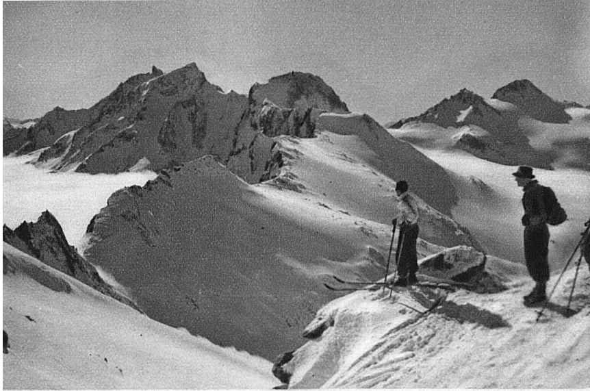
Im Rotondogebiet bei Andermatt — La région de Rotondo dans les environs d'Andermatt