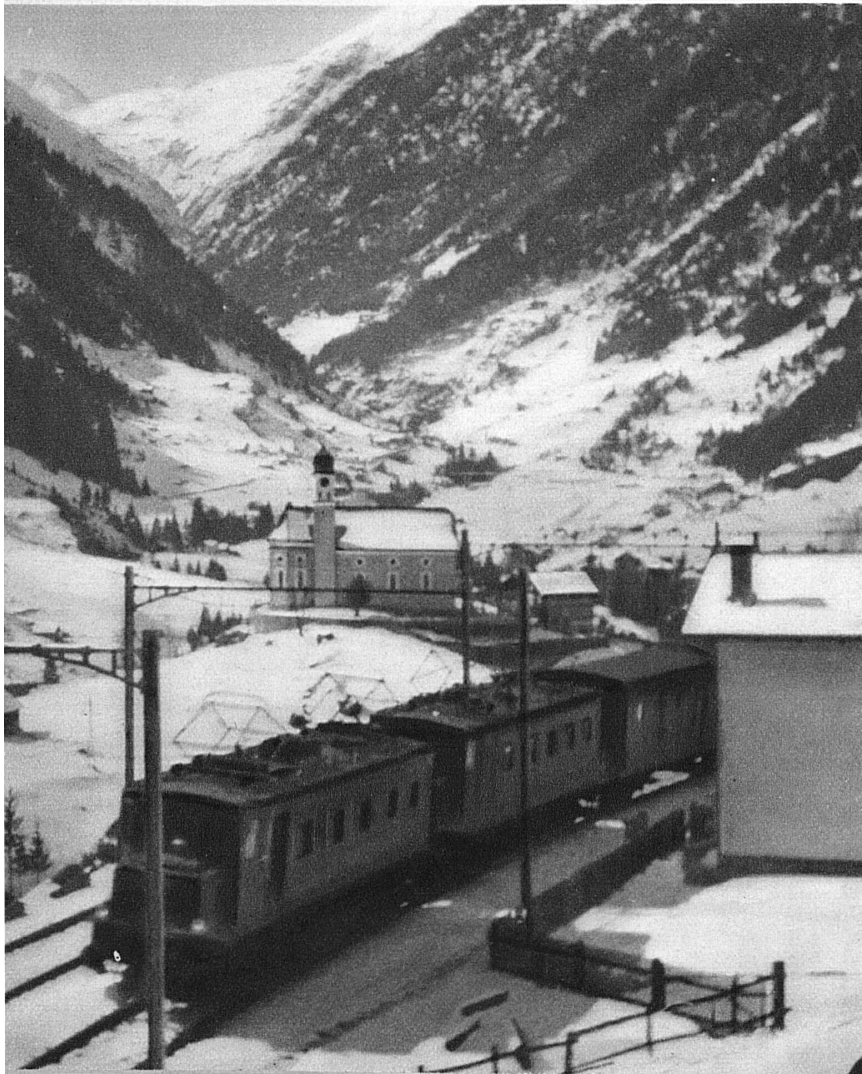
Andermatt entgegen! Das berühmte Kirchlein von Wassen — En route pour Andermatt! La célèbre petite église de Wassen

Das Grosse Landesrennen der Schweiz erhält von Jahr zu Jahr erhöhte Bedeutung. Beschickung und Auslese für Spitzenleistungen gewinnen immer mehr. Die verschiedenen Disziplinen werden in erweiterter Form – gemäss Beschlüssen der Bieler Delegiertenversammlung – neu durchgeführt, um auf versuchsweiser Grundlage die Meisterschaft neu zu kombinieren mit Abfahrt und Slalom. Das zeigt den wirklich fortschrittlichen Geist, der durch die schweizerische Skibewegung geht. Der Skimeister wird dieses Jahr somit probeweise in einer Viererkombination vergeben: