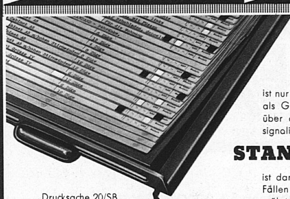
Drucksache 20/SB orientiert Sie eingehend