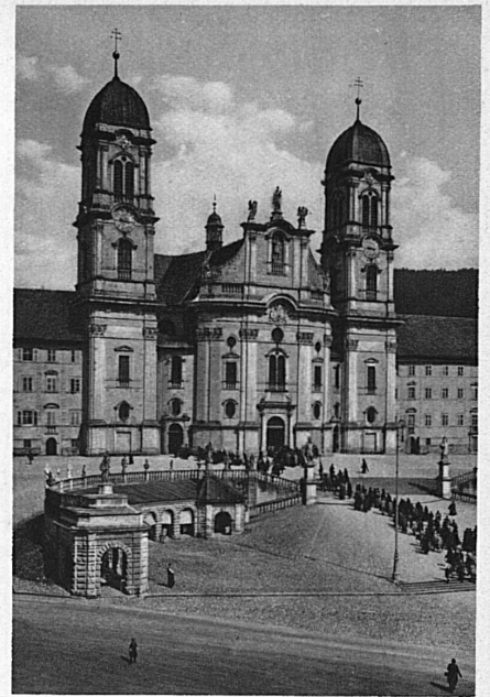
Klosterkirche in Einsiedeln

man mit dem alten Grundsatz brach, nur Angehörige des Hochadels in den Klosterverband aufzunehmen. In der französischen Revolution 1798 wurden die Mönche von den heranrückenden französischen Soldatenhorden vertrieben, das Kloster vollständig ausgeraubt und die sogenannte Gnaden- oder Wallfahrtskapelle innerhalb der Klosterkirche dem Erdboden gleichgemacht. Nach ein paar Jahren konnten die geflüchteten Mönche wieder ins arg verwüstete und ausgeplünderte Kloster zurückkehren. Es begannen die Jahre und Jahrzehnte innerer und äusserer Aufbauarbeit, in denen die Mönche bestimmend und beeinflussend sich auch den Kulturaufgaben der modernen Zeit widmeten. Mitte des letzten Jahrhunderts zog eine Gruppe von Patres aus, um in der neuen Welt als Benediktinermisionare den Geist des Christentums und benediktinischen Mönchtums in die weiten, damals noch indianerreichen Gegenden Nordamerikas zu verpflanzen. Die Klöster St. Meinrad, Neu-Sabiaco, Richardton sind Tochtergründungen Einsiedelns.