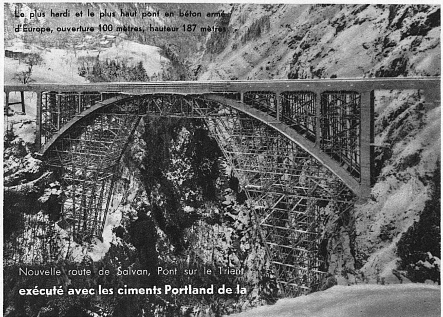
Le plus hardi et le plus haut pont en béton armé d'Europe, ouverture 100 mètres, hauteur 187 mètres

Entreprises réunies: COUCHEPIN, DUBUIS et CIE