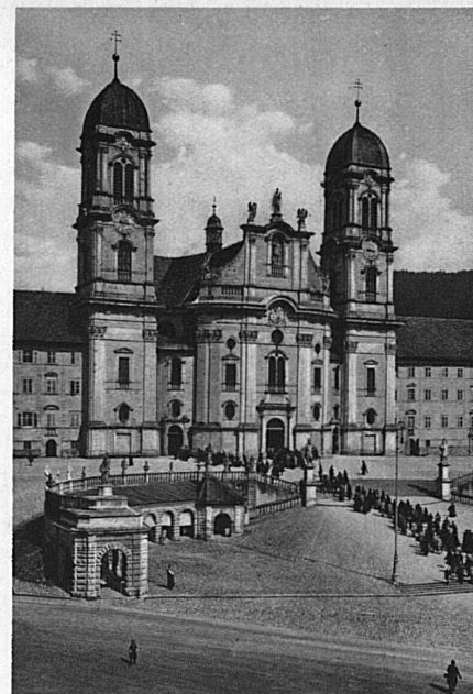
Klosterkirche in Einsiedeln

man mit dem alten Grundsatz brach, nur Angehörige des Hochadels in den Klosterverband aufzunehmen. In der französischen Revolution 1798 wurden die Mönche von den heranrückenden französischen Soldatenhorden vertrieben, das Kloster vollständig ausgeraubt und die sogenannte Gnaden- oder Wallfahrtskapelle innerhalb der Klosterkirche dem Erdboden gleichgemacht. Nach ein paar Jahren konnten die geflüchteten Mönche wieder ins arg verwüstete und ausgeplünderte Kloster zurückkehren. Es begannen die Jahre und Jahrzehnte innerer und äusserer Aufbauarbeit, in denen die Mönche bestimmend und beeinflussend sich auch den Kulturaufgaben der modernen Zeit widmeten. Mitte des letzten Jahrhunderts zog eine Gruppe von Patres aus, um in der neuen Welt als Benediktinermisionare den Geist des Christentums und benediktinischen Mönchtums in die weiten, damals noch indianerreichen Gegenden Nordamerikas zu verpflanzen. Die Klöster St. Meinrad, Neu-Sabiaco, Richardton sind Tochtergründungen Einsiedelns.