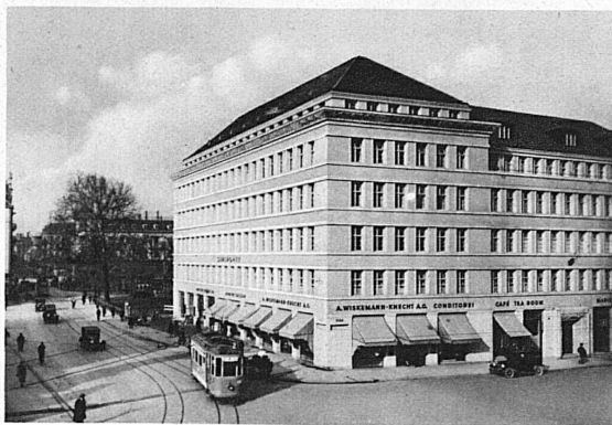
Grand Café Sihlporte, Zürich